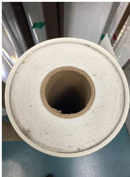
Илл. 2: Неправильная размотка