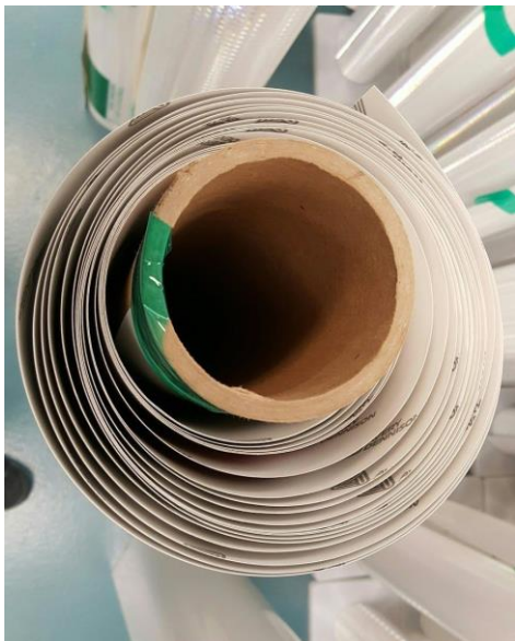
Илл. 1: Правильная размотка